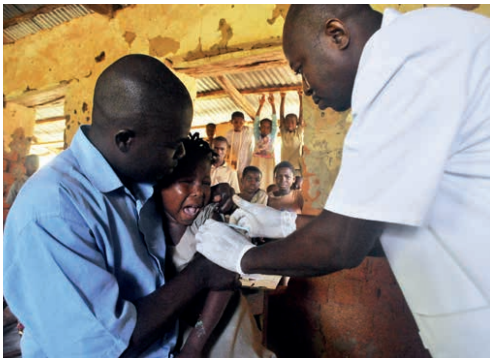
Vaccination dans les écoles

En 2014 et en 2015 4044 patients ont bénéficié d'une consultation médicale itinérante.