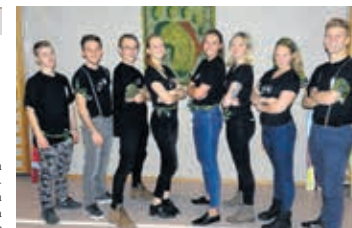
Les étudiants du gymnase de Morges étaient au service.