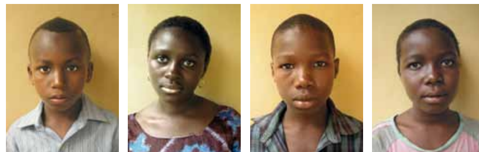
Quelques jeunes élèves bénéficiant d'une aide scolaire