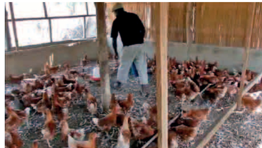
L'élevage de Edem Agbeme

Le projet de l'élevage des poules pondeuses de Edem AGBEME, dans la préfecture de Kpélé, a été soutenu par FAM, lors de la période de pontes. L'apport a consisté à l'approvisionnement des céréales pour l'alimentation des volailles.